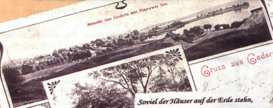
Gruss aus Godern.