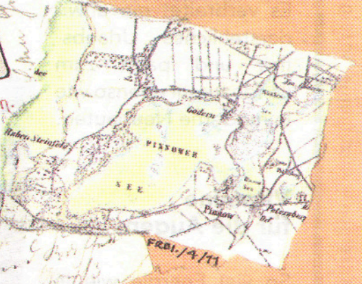
FRI. / 4. / 11

Soviel der Häuser auf der Erde stehn, Hat jedes Haus doch seinen eignen Geist Und an der Schwelle schon fühlst du ihn wehn, Wenn dich des Hauses Herr willkommen heißt.